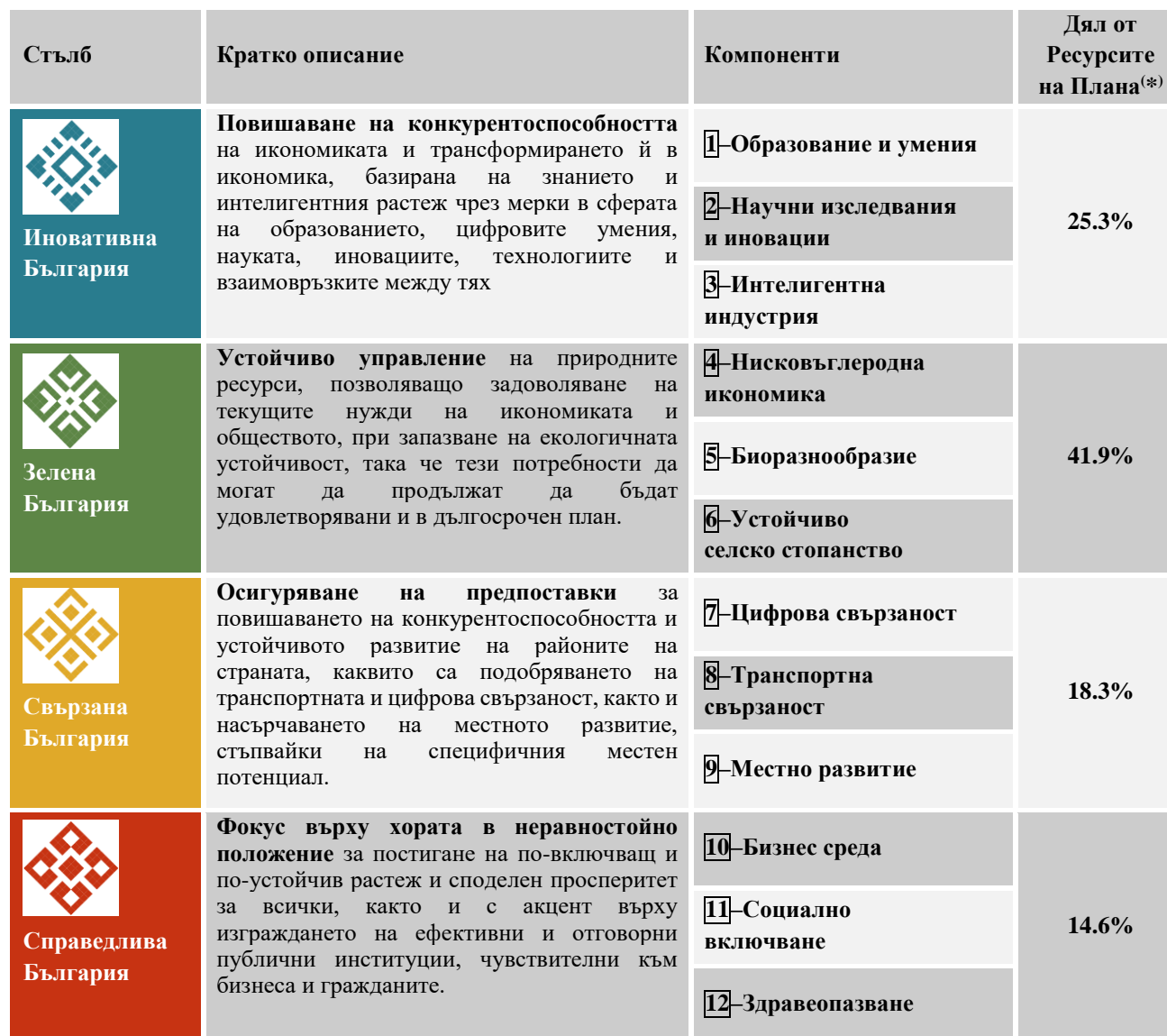
Таблица 2.6-1 – Обхват и структура на Национален план за възстановяване и устойчивост.

(*) – Процентите не са точно 100%, поради закръгляване на числата до десети.