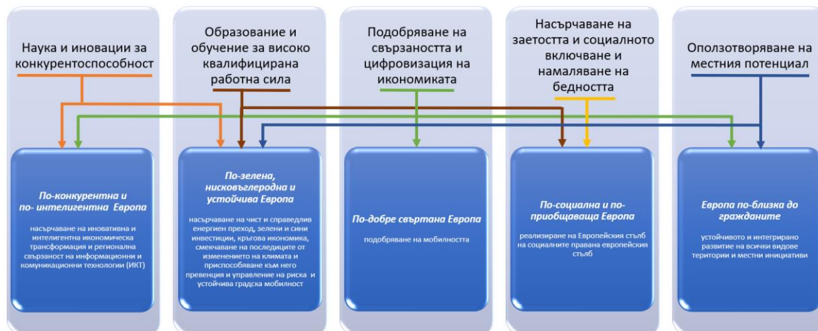
Фигура 2.9-1 – Връзка между националните приоритети и основните цели на Политиката за сближаване през периода 2021-2027г.

Връзката между националните приоритети и основните цели на Политиката за сближаване през периода 2021-2027г.е показана на Фигура 2.9-1 .